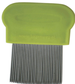
Metalen netenkam= behandel kam