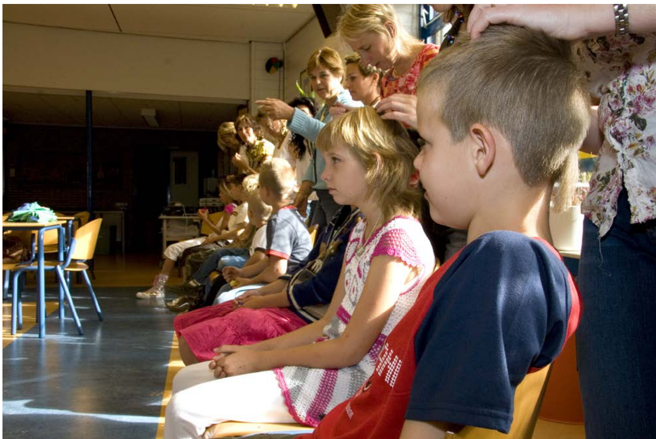
Een ouderwerkgroep kan op school de kinderen regelmatig controleren.