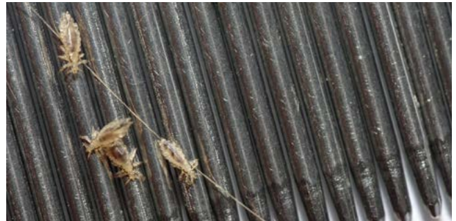
Hoofdluizen op een kam.

Kinderen tussen de 3 en de 12 jaar krijgen vaker hoofdluis omdat ze tijdens het spelen vaak letterlijk de hoofden bij elkaar houden.