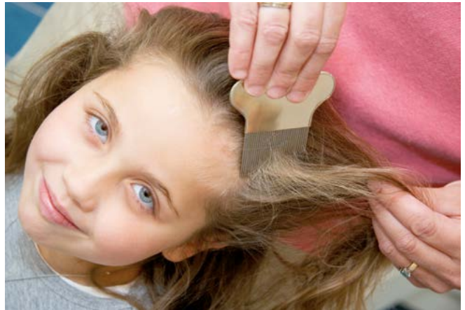
De uitkambehandeling is de meest natuurlijke aanpak tegen hooftluis.

Let op: een kind dat behandeld is met een middel waar malathion in zit, mag op de dag van de behandeling niet zwemmen. Dit omdat chloor de werking van malathion tegengaat. Vraag eventueel advies aan apotheek of drogist.