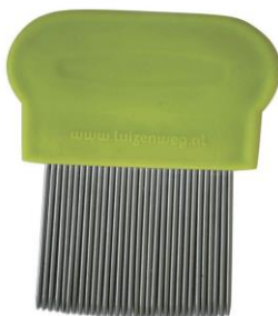
Metalen netenkam= behandel kam